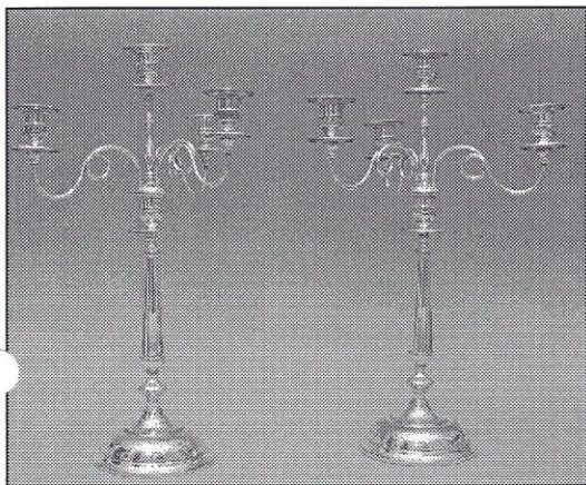
Ljusstakarna i försilvrad mässing med inskription.

I vår familj har vi ett par ståtliga ljuskandelabrar i försilvrad mässing, 48 cm höga. Båda två bär inskriptionen "Till S. J. Johannesson med fru vid skolinvi-ningen i Gräsholma 19 15/8 12 från åbor i Gräsholma o Åsa. En gård av tacksamhet."